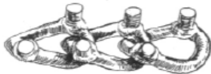
Поперечная шипованная цепь (перемычка)