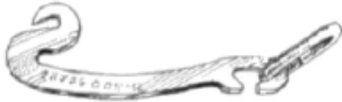
Внешний затяжной рычаг для цепи